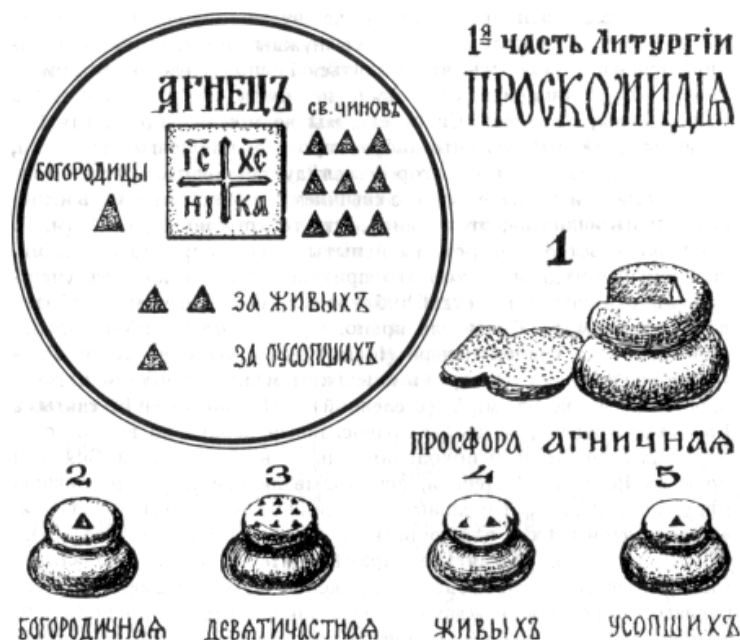
Рисунок 5.1. Проскомидия: служебные просфоры и расположение вырезанных из них частиц на дискосе.

Проскомидия совершается на жертвеннике. Священник берет первую , Агничную , просфору и копием делает на ней трижды изображение креста, произнося: « В воспоминание Господа и Бога, и Спаса нашего Иисуса Христа ». Из этой просфоры священник копием вырезает середину в форме куба, произнося при этом слова пророка Исаии: « Яко (как) овча на закление ведеса и яко агнец непорочен, прямо стригущего его безгласен, тако не отверзает уст своих; во смиреніи его суд его взятся; род же его кто исповестъ; яко вземлется от земли живот (жизнь) его » (Ис.53.7-8). Эта кубическая часть просфоры называется Агнецем , действием Святого Духа она будет прелagаться на Литургии верных в Тело Христово.