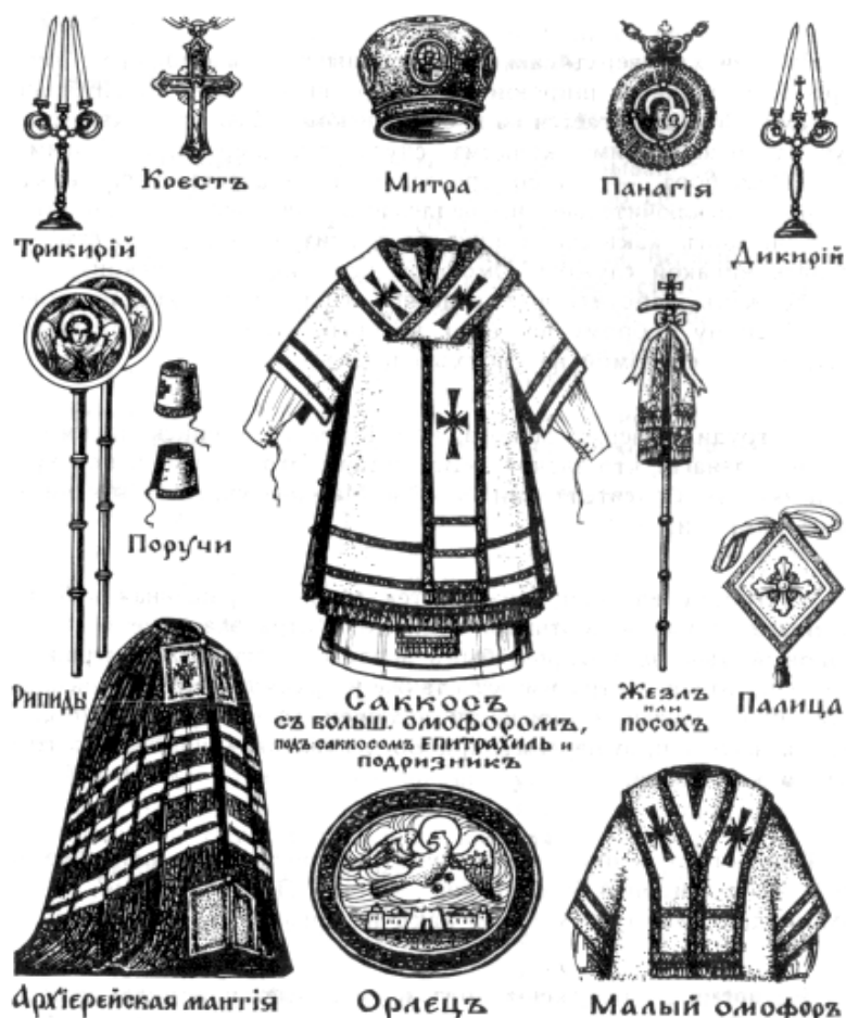
Рис.4.6. Облечение епископа

Саккос – верхняя одежда епископа, похожая на укороченный снизу и в рукавах диаконский стихарь, так что из-под саккоса у епископа видны и подризник, и епитрахиль. Саккос, как и риза у священника, знаменует собою багряницу Спасителя.