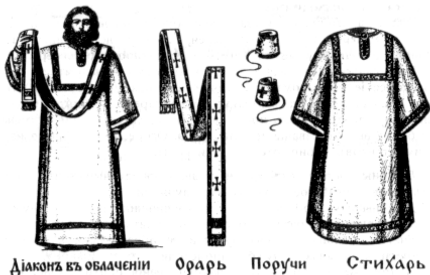
Рис. 4.4. Облачение диакона

Стихарь - длинная прямая одежда с широкими рукавами. Он знаменует чистоту души, которую должны иметь лица священного сана. Стихарь полагается и для иподиаконов. Право ношения стихаря может быть дано псаломщикам и прислуживающим в храме мирянам.