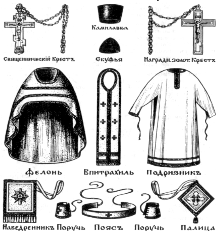
Рис. 4.5. Облачение священника

Подризник - это стихарь в несколько измененном виде: он делается из тонкой белой материи, и рукава у него узкие, затягивающиеся на концах шнурками. Белый цвет подризника напоминает священнику, что он должен всегда иметь чистую душу и проводить беспорочную жизнь. Подризник символизирует собою хитон (нижнюю одежду) Спасителя.