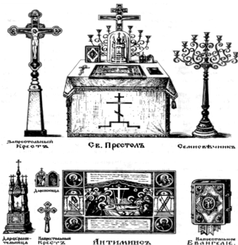
Рис.4.2. Святой престол и священные предметы, хранящиеся на нем и рядом с ним.

На престоле находятся антиминс, Евангелие, крест, дарохранительница и дароносица.