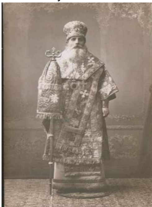
Рис. 1. Еп. Воткинский Амвросий (Казанский) в архиерейском облачении (фото 1920-х гг.)

Во время Богослужения под ноги епископу подкладываются орлецы — небольшие круглые коврики с изображением орла, летящего над городом. Орлецы означают, что епископ должен, подобно орлу, возноситься от земного к небесному.