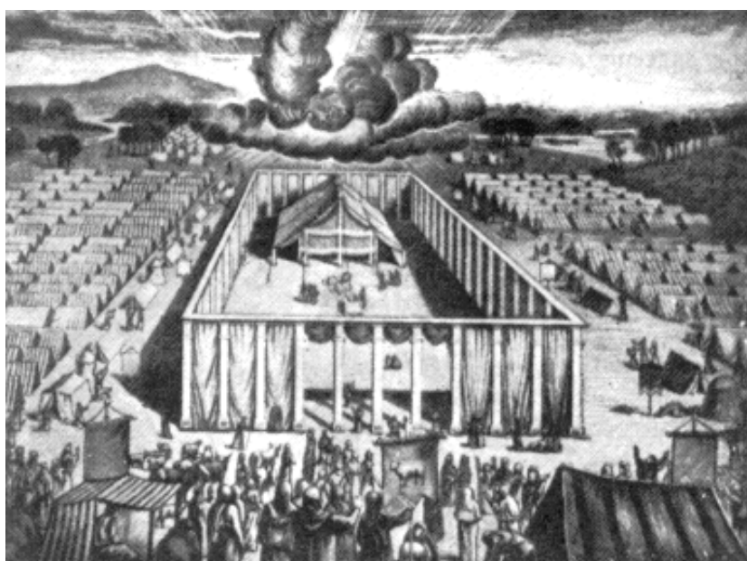
Рис.1.1. Общий вид скинии (слева) и находящиеся в ней

На дворе, перед входом в скинию, стоял жертвенник всежжения, окованный медью, и большая медная умывальница для омовения рук и ног священников перед богослужением. Вход в Скинию был с восточной стороны, так что Святая Святых в противовес языческим алтарям обращена была к западу.