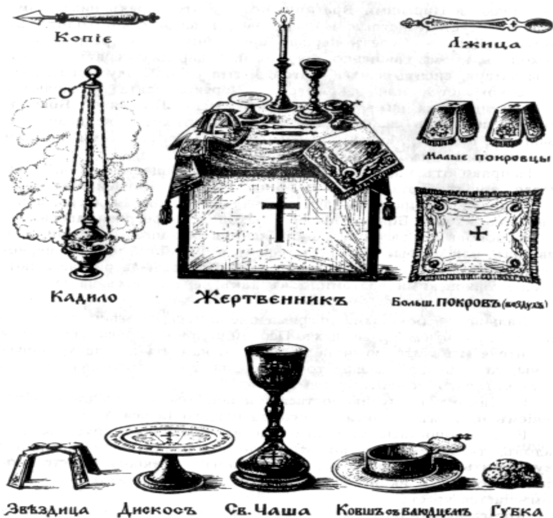
Рис.4.3. Жертвенник и священные предметы, находящиеся на нем.

Большой покров, покрывающий вместе чашу и дискос, называется воздухом . Он знаменует собою то воздушное пространство, в котором явилась звезда, приведшая волхвов к яслям Спасителя. Все покровы изображают пелены, которыми Иисус Христос был повит при рождении и Его погребальные пелены (плащаницу).